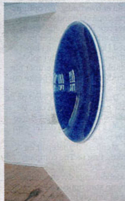
Serina Erfjord, Normal. Blue , olje og pigment på parabolantenne.