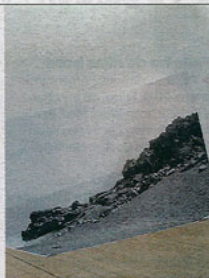
Sandra Vaka Olsen, Grain Picture Sand Place , fotografi.